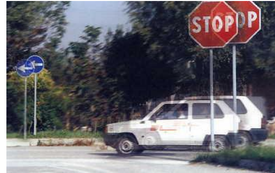
intossicazione da alcol etilico